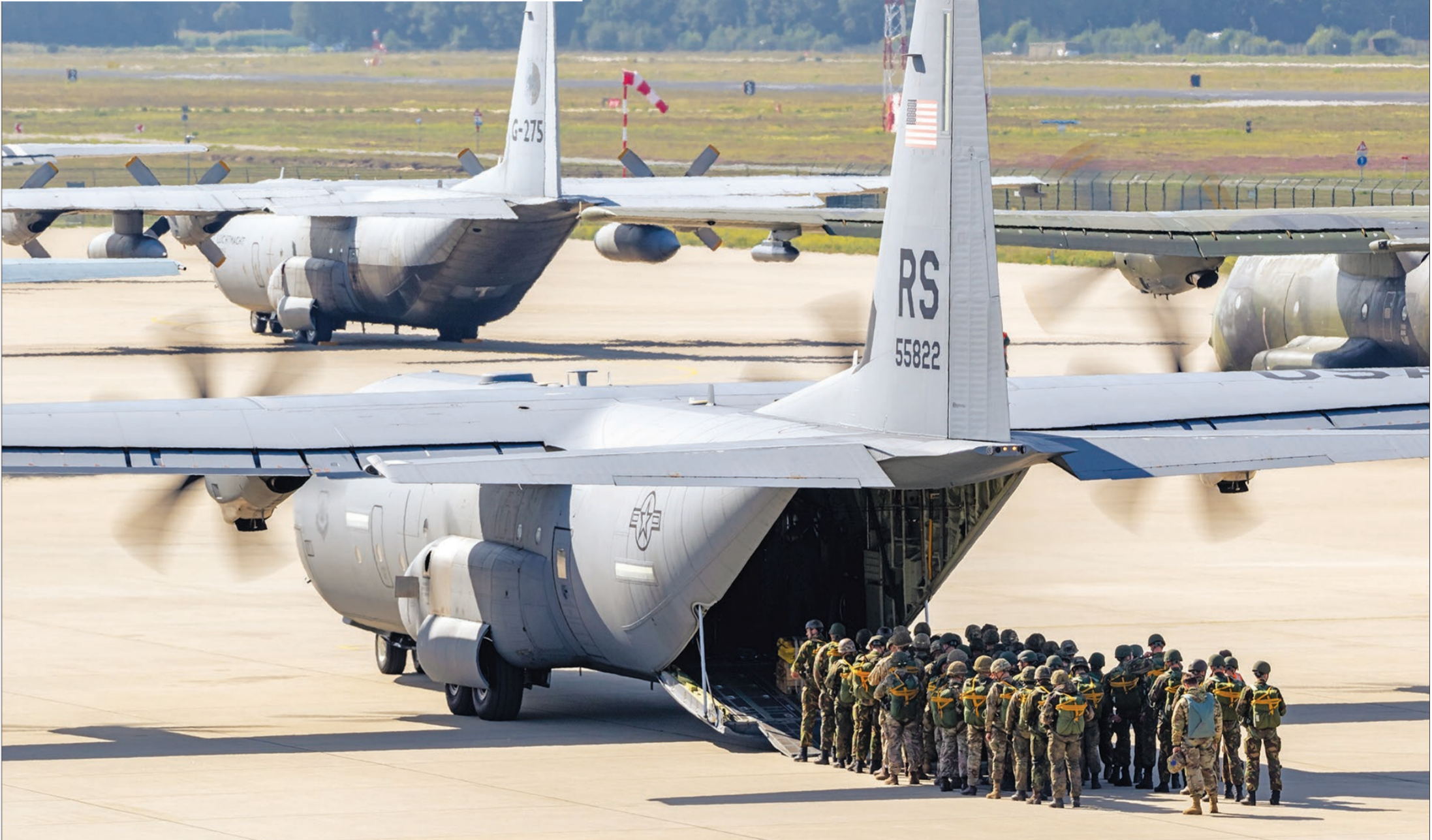
Αμερικανικό μεταγωγικό αεροσκάφος C-130J

Προκειμένου να παραχωρηθεί το αεροδρόμιο για χρήση νατοϊκών δυνάμεων είναι απαραίτητο η Συμμαχία να έχει εκπονήσει προηγούμενος και να έχει εγκρίνει συγκεκριμένη στρατιωτική επιχείρηση των δυνάμεων του NATO (όπως π.χ. είχε γίνει με το αεροδρόμιο του Αράξου στους νατοϊκούς βομβαρδισμούς στη Λιβύη εναντίον του Καντάφι). Η Ατλαντική Συμμαχία δεν έχει εμπλακεί μέχρι στιγμής στον πόλεμο Ισραήλ - Χαμάς και ως